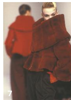
6. JEAN PAUL GAULTIER, DÉFILÉ PRÊT-À-PORTER, A/H 1986-87 © GUY MARINEAU 7. CLAUDE MONTANA, DÉFILÉ PRÊT-À-PORTER, A/H 1988-89 © GUY MARINEAU

le chapitre d'une décennie placée entre évasion et pragmatisme d'une grande jeunesse. Mugler anticipe le portrait du créateur demiurge et visionnaire des années 1980.